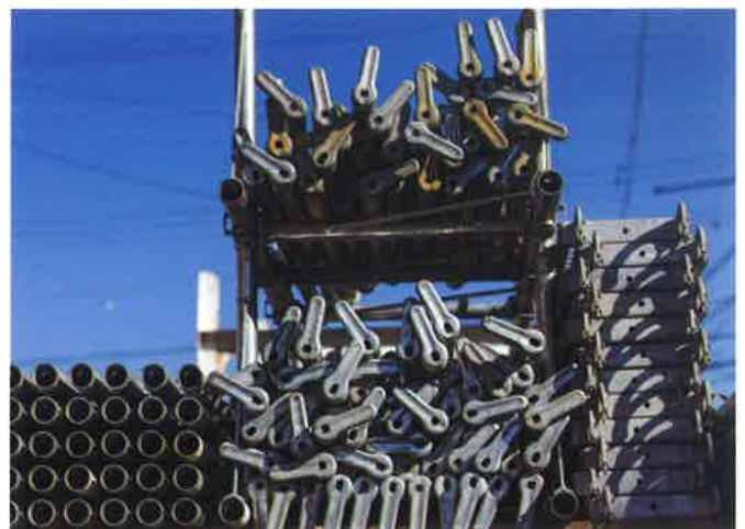
オダコーポレーション(株)