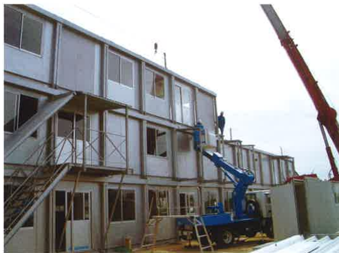
大和リース(株)アシストⅣ型

ユニットハウス課では、並べる・重ねる・つなげるを合言葉に連棟システムのユニットハウスを取り扱っています。お客様の御要望にお応えできる品物作りを心掛け、納得して頂ける施工をモットーに日々努力しています。現場での車両(クレーン車等)の出入りも短時間で、騒音等近隣への影響が少ないことや、廃材も少なく塗装の吹き付けもない為、環境にも優しい等、近隣へのお気遣いも最小限ですむように心掛けております。又、施工後のアフターサービスも行っておりますので、安心してご利用下さい。