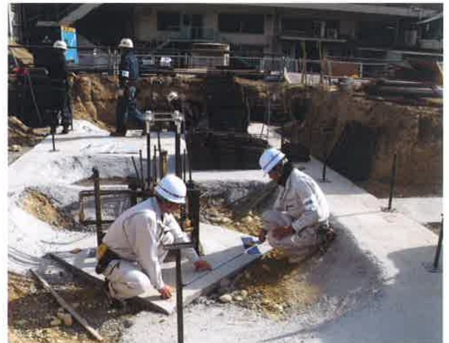
■現場名／三井造船(株)監督官事務所新設工事