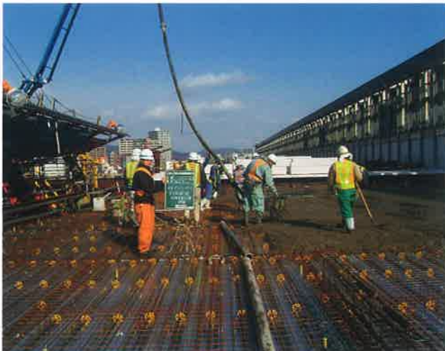
■現場名／JR岡山駅自由通路新設工事

業務に適した有資格者が現場の施工・管理・処理をサポートいたします。長期・短期契約や日中勤務・夜勤務と現場の必要に応じて対応いたします。